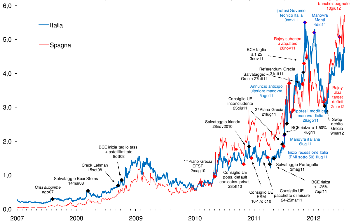
Spread e cattive notizie si rimbalzano da paese a paese (Rendimenti dei titoli di Stato a 10 anni; punti percentuali)

La prova del contagio. Il contagio è dimostrato dal netto cambiamento della correlazione tra gli spread sui rendimenti dei titoli di Stato a lungo termine di ciascun paese rispetto ai Bund tedeschi, che prima della crisi si muovevano coralmente in tutta la zona euro, mentre dal 2008 in poi procedono insieme in due gruppi distinti: da un lato gli spread dei paesi core e dall'altro quelli dei paesi periferici (Grafico B). Il contagio riflesso negli spread trasmette da una nazione all'altra le cattive notizie politico-economiche che riguardano il singolo paese. Esempiare ed esemplificativo è il caso spagnolo-italiano, i livelli dei cui spread si sono rincorsi, compiendo uno scalino all'insù ogni qualvolta da una o dall'altra delle due economie giungevano novità negative. Così, ad esempio, è stato quando la Spagna ha annunciato di essere fuori linea con i target di finanza pubblica o quando i dati congiunturali italiani hanno rivelato una recessione più profonda (Grafico C).